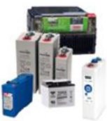
Tipo de Bateria