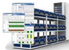
Sistema de Monitoramento de Bateria