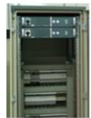
Chaves de transferência automática (ATS)