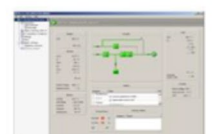
Software de monitoramento