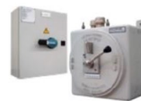
Caixa de proteção de circuito de Bateria