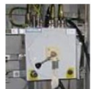
Bateria Black Start