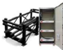
Instalação de Bateria