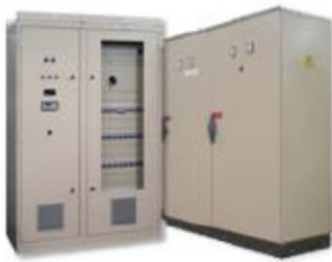
Distribuição CC & CA