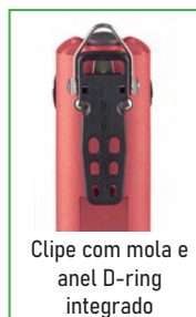
Clipe com mola e anel D-ring integrado