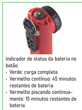
Indicador de status da bateria no botão: • Verde: carga completa • Vermelho contínuo: 45 minutos restantes de bateria • Vermelho piscando continua- mente: 15 minutos restantes de bateria