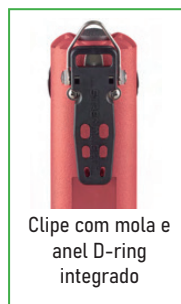
Clipe com mola e anel D-ring integrado