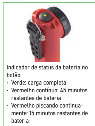
Indicador de status da bateria no botão: • Verde: carga completa • Vermelho contínuo: 45 minutos restantes de bateria • Vermelho piscando continua- mente: 15 minutos restantes de bateria