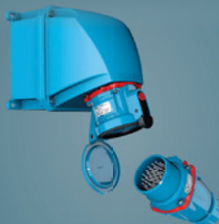
TOMADAS E CONECTORES PARA AMBIENTES SEVEROS