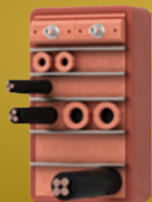
SISTEMAS PARA SELAGEM DE PASSAGEM DE CABOS E TUBOS