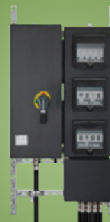
LUMINÁRIAS, CAIXAS DE JUNÇÃO, PAINÉIS DE DISTRIBUIÇÃO, COMANDOS, TOMADAS