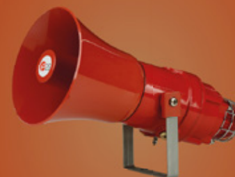
SINALIZAÇÃO AUDIOVISUAL INDUSTRIAL