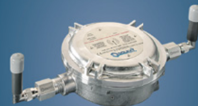
COMUNICAÇÃO E MONITORAMENTO WI-FI E ETHERNET Ex