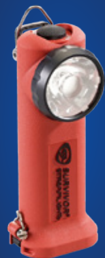
LANTERNAS LED PROFISSIONAIS