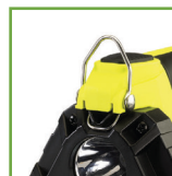
Mecanismo de trava mantém a cabeça giratória no lugar