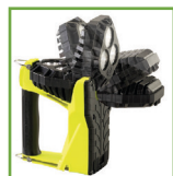
Cabeça giratória 180°