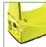
Status da bateria/indicador de carga