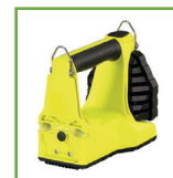
LEDs traseiros garantem que você pode ser visto mesmo por trás. Podem ser programados para ligar ou desligar.

GARANTIA STREAMLIGHT: As lanternas possuem garantia vitalícia contra defeitos de fabricação. Esta condição é válida somente para o corpo das lanternas. As baterias recarregáveis, carregadores, chaves, interruptores e eletrônicas são garantidos por até 2 (dois) anos, mediante prova da aquisição. A garantia não cobre danos acidentais ou por quaisquer usos indevidos das lanternas.