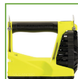
O espaço livre do punho acomoda luvas pesadas, facilitando as mãos livres